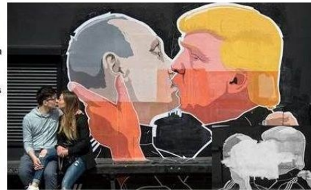
"Mural" in Vilnius, die na een paar dagen reeds was beschadigd door "Poetin-lovers"

Omdat beelden van een repressieve Sovjet-dictatuur nog steeds niet uit het dagelijkse bestaan zijn verdwenen, bleven en blijven regeringsleiders van de buur-landen hardnekkig aandacht vragen voor de dreiging van de territoriale ambities van Poetin. In Vilnius is bijvoorbeeld nog steeds de oude KGB-gevangenis te bezichtigen, met zijn martel- en executie-kamers die nog tot 1991 in gebruik zijn geweest en waar duizenden Litouwers werden vermoord. Begrijpelijk dat de inwoners van de Baltische landen de door de media geschilderde ontwikkelingen tijdens de Amerikaanse verkiezingsrace en vooral Trumps veronderstelde bewondering voor Vladimir Poetin, met een zwaar gemoed en groeiende angstgevoelens hebben gevolgd. De schildering die na de verkiezingsuitslag op een muur in Vilnius werd aangebracht, is daarvan een tastbare bevestiging. Overigens werd die muurschildering een paar dagen later door "Poetin-bewonderaars" 4 zwaar beschadigd.