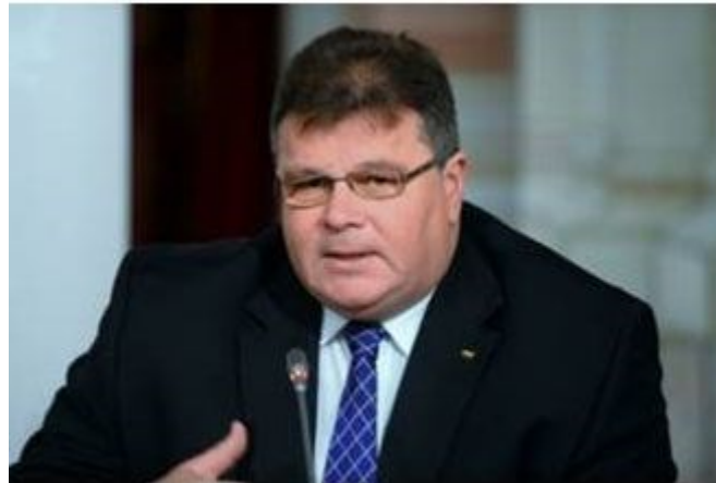
De Litouwse minister van Defensie: Linas Linkevičius

paying their fair share....and that bothers me, because we should be asking...we're defending them, and they should at least be paying us what they're supposed to be paying by treaty and contract..." helaas de spijker op de kop.