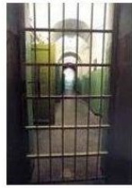
Ondergrondse gangen in het gebouw dat tot 1991 nog volledig in bedrijf was