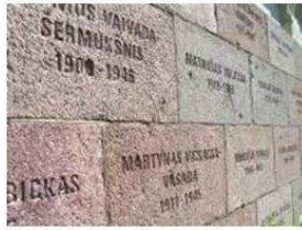
Muur van het KGB museum, waar de namen van de meest prominente vermoorde gevangenen staan gebeiteld