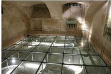
Martel- en executiekamer waar door de KGB duizenden politieke gevangenen werden vermoord