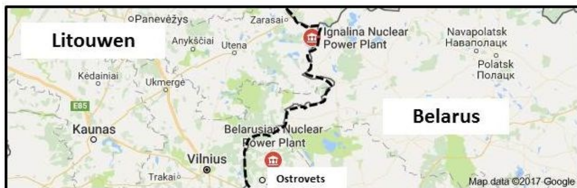
De Ostrovets NPP op 41 kilometer van Vilnius

Om Lukashenko definitief te overtuigen in welke tent hij bij regen en onweer zou moeten schuilen, heeft Poetin besloten om in de omgeving van Ostrovets, op nog geen 40 kilometer van Vilnius, de Ostrovets Nuclear Power Plant (ONPP) versneld te operationaliseren. In 2013 hebben Minsk en Moskou specialisten dertig locaties op hun mogelijkheden voor een NPP laten onderzoeken en hoewel Ostrovets niet in de top van de beste keuzes stond, is op basis van andere criteria toch gekozen voor Ostrovets.