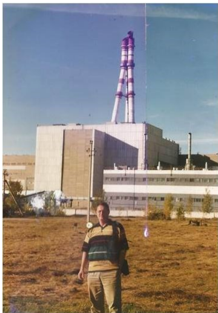
Schrijver voor de NPP Ignalina in 1994

van de EU (ENTSO) 3 om hun energie-afhankelijkheid van Moskou te minimaliseren 4 . In feite was dat plan het gevolg van de voorwaarde die de EU aan Litouwen had gesteld voor een lidmaatschap, nl. sluiting van de verouderde kerninstallatie van Ignalina. 5 Moskou heeft aan de EU verzocht om in de integratieplannen voor de drie Baltische staten ook de Russische enclave Oost Pruisen/Kaliningrad mee te nemen en een verbinding tussen Oost Pruisen en Polen te realiseren. De EU heeft daar afwijzend op gereageerd en Litouwen heeft vervolgens maatregelen genomen om Oost Pruisen/Kaliningrad te isoleren.