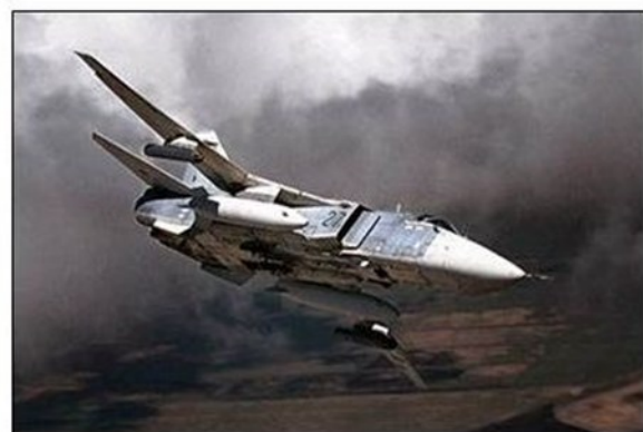
Sukhoi 24 M FENCER