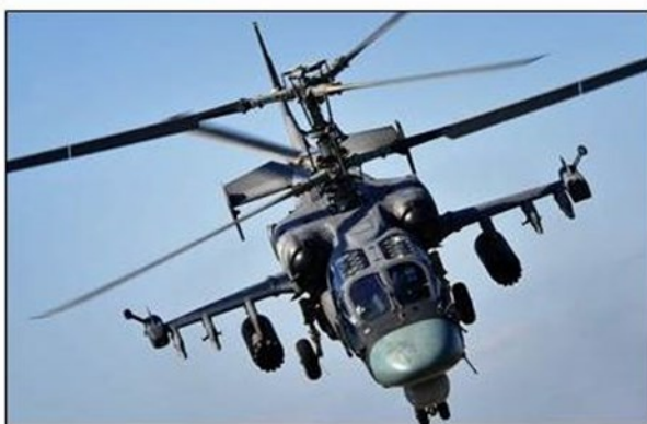
Ka 52 Attack helicopter

bezetten, waarna vervolgens pogingen ondernomen zouden worden om Veishnoria los te weken van Belarus. Het uiteindelijke doel zou zijn dat militanten gesteund door de twee geallieerde landen; Vesbarija en Lubenja , de regering in Minsk omver wilden werpen. De gecombineerde Minsk-Moskou strijdmacht moest het door de extremisten gevormde bruggenhoofd afblokken en de gewenste randvoorwaarden realiseren in termen van gevechtskrachtverhouding en gunstige terreinomstandigheden voor een succesvol tegenoffensief. Het script van dit scenariodeel speelde zich volledig af op schietterreinen waar gevechtsschietoefeningen werden afgewerkt en oefeningsgebieden waar luchtmobiele en luchtlanding acties werden ontplooid en luchtplatformen hun oefeningsdoelen in een grond- lucht bestrijdingsoperatie probeerden te realiseren. In dat scenario was de inzet van luchtplatformen als Ka52 aanvalshelikopters en Sukhoi SU 24-M jachtbommenwerpers, drones en kruisraketten opgenomen.