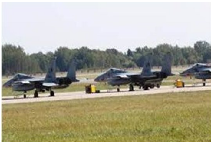
NATO sends extra Eagles F-15-C to Siauliai, Lithuania during ZAPAD 2017.