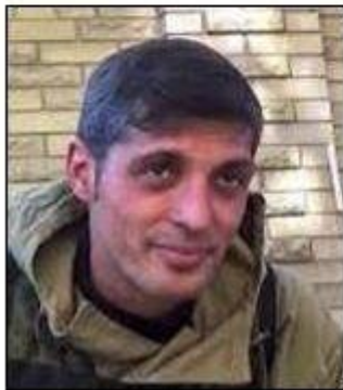
Mikhail "Givi" Tolstykh