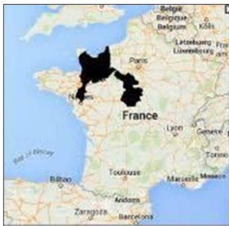
Grootte van het bezet gebied in Oekraïne, geprojecteerd op een kaart van Frankrijk

Rusland kan dan eigen artillerie-eenheden zonder schending van de akkoorden aan de Oekraïens -Russische grens operationeel houden.