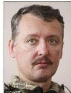
Igor "Strelkov" Girkin