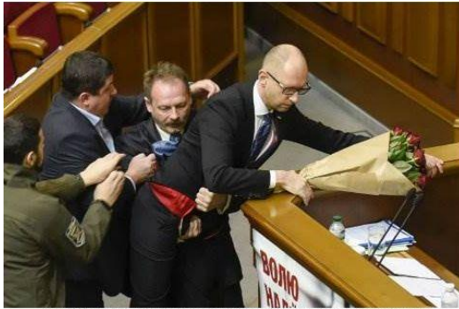
Handgemeen in de Rada, waar Minister President Yatsenyuk door een parlementarier van de coalitiepartner van de partij van President Poroshenko wordt aangevallen

Putin wacht ook af en hoopt op een het uiteenvallen van de heersende coalitie van het blok van de president Poroshenko en de partij van de minister-president Yatsenyuk, waarbij Putin hoopt dat het uiteenvallen van de coalitie automatisch zal leiden tot destabilisatie van het land, gevolgd door desintegratie 1 . Het vervolg zal in Putin' s berekening kunnen leiden tot het federaliseren van het land, waarmee Putin zijn