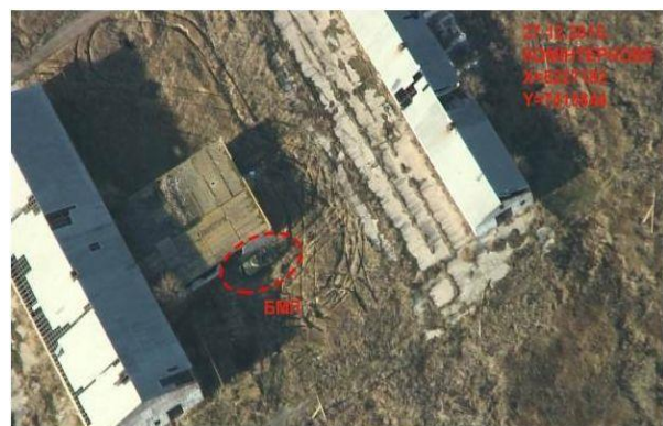
Verdekt opgestelde pantserinfanterie en tanks