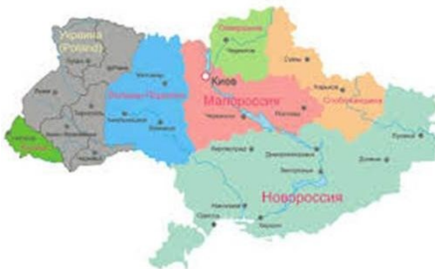
Gedachte kaart van "Malorossyia" Het oostelijk en zuidelijk deel wordt gevormd door de gebieden van "Novorossyia" (De Krim staat op deze kaart niet aangegeven als deel van de nieuwe entiteit)

Die naam die in de 18 de eeuw werd gegeven aan het gebied tussen Dnjepr en Don-Wolga ten zuiden van de Pripyatt moerassen en ten noorden van de door het Kremlin gewenste geografische grens van Novorossyia of het klassieke Zuid Rusland. Volgens Zakharchenko's (1976-2018) de voormalige sterke man van de Volksrepubliek Donetsk 11 , zal het moderne Malorossyia