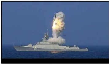
De SS-N-30 (3M-14 Kalibr) is een Russische Land Attack cruise missile (LACM). Het wapensysteem heeft een bereik tussen de 1500 en 2500 kilometer