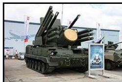
Pantsir-S Mobiel luchtverdedigingsysteem uitgerust met snelvuurkanonnen en geleide wapens