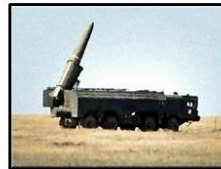
Iskander, afhankelijk van de versie een bereik tot 2000 kilometer

Vanzelfsprekend heeft Moskou ook op de Krim niet stilgezeten. Sinds de Russische “annexatie” zijn er voortdurend militaire middelen op het schiereiland gestationeerd om de druk op de Oekraïne te verhogen. NATO inlichtingendiensten hebben bevestigd dat