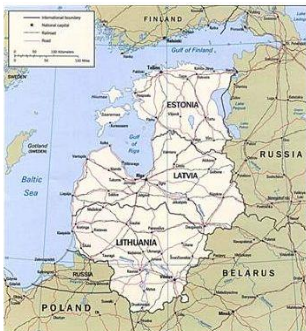
De Baltische regio

Het scenario speelt zich af begin 2016. Omdat het Westen in juli 2015 de sancties tegen Rusland heeft opgeschort, meende de Franse regering dat er geen belemmeringen meer waren om de door Rusland bestelde helikoptercarriers aan Moskou over te dragen. Eind 2015 zijn dientengevolge beide schepen waaraan Moskou de namen “Sint Petersbrug” en “Moskwa” hebben gegeven in Rusland afgeleverd.