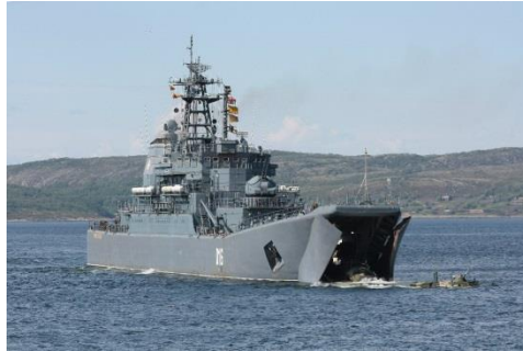
landingschepen van de Ropucha-klasse