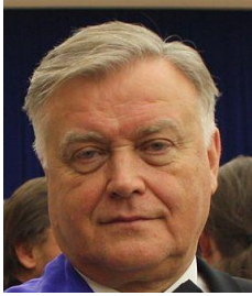
Vladimir Yakunin (1948).

De markante baas van de Russische spoorwegen. Met ruim een miljoen werknemers een staat binnen de staat. Het bedrijf, inclusief luchtvaartdivisie, vervoert met militaire precisie passagiers en vracht dwars door de acht tijdzones van Rusland.