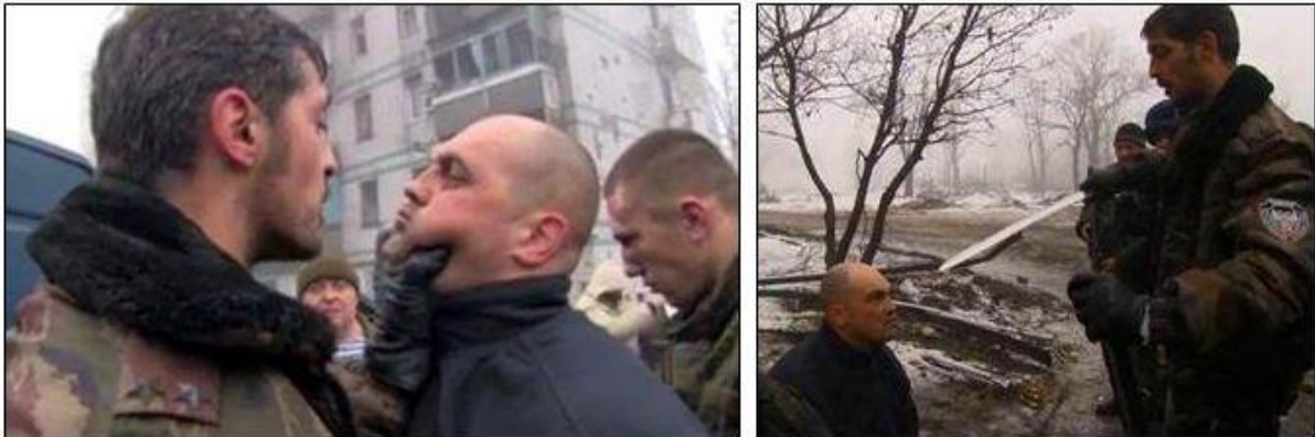
“Motorola”, een bekende Oekraïense oorlogsmisdadiger, onlangs gesignaleerd in Damascus

vermoord. Uit het verschijnen van deze man kan worden afgeleid dat hij niet alleen naar Syrië is gekomen.