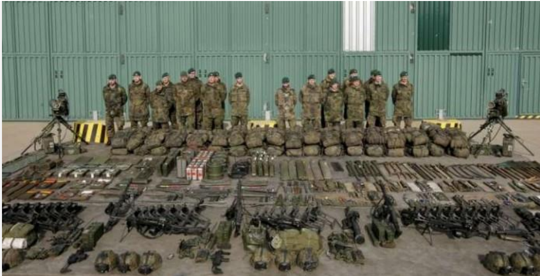
Snapshot van Panzergrenadier Batallion 371.

De tekst op de NAVO-website: “. . . this force is now in transition as military staff work to phase in the concept of a VJTF into the overall NRF structure. ” [10] geeft weliswaar inhoud aan goede voornemens, maar camoufleert de hoogte van het aantal hindernissen dat overwonnen moet worden. In diverse artikelen die de afgelopen jaren in Carré zijn gepubliceerd, is de problematiek van de NRF uitgebreid aan de orde geweest en die is door het geven van een andere naam helaas niet opgelost. Ieder woord waarmee de aangedikte NRF benoemd wordt kent zo veel operationele en politieke knelpunten, dat een operationeelstelling in 2017 vrijwel niet mogelijk is. Geld, tijd en faciliteiten zijn daarbij bepalende factoren en geld voor Defensie is een schaars artikel in West-Europa.