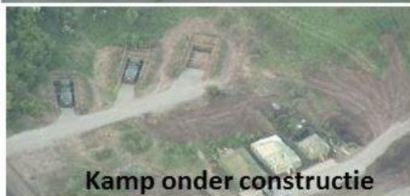
Kamp onder constructie