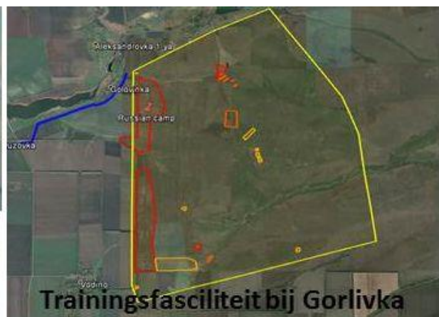
Trainingsfaciliteit bij Gorlivka