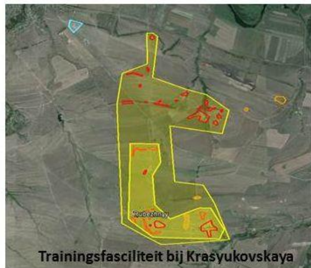
Trainingsfaciliteit bij Krasnyukovskaya