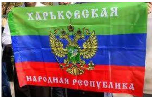
De “Kharkiv Partisanen”

Daar werd de hoofdaanval gericht op de op één na grootste stad van Oekraïne; Kharkiv. En bovendien op de in grootte de derde stad in Oekraïne: Dnipropetrovsk. Kharkiv heeft met zijn vijftien miljoen inwoners een uitgesproken pro-Russische burgemeester: Hennadiy Kernes. Kernes 9 is lid van een “nieuwe” partij: Vidrozhennya (“Revival of “Wedergeboorte”) die veel leden telt uit de inmiddels verboden partij (Partij van de Regio’s 10 ) van de toenmalige gevluchte president van Oekraïne: Viktor Yanukovich. Bovendien kent Kharkiv een prima functionerende