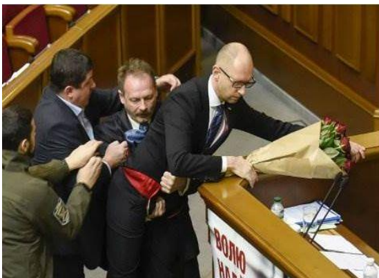
Handgemeen in de Rada, waar Minister President Yatsenyuk door een parlementarier van de coalitiepartner van de partij van President Poroshenko wordt aangevallen

In voorgaande artikelen is uitvoerig uit de doeken gedaan welk financieel kruis Moskou in de Donbas moet dragen. De schatkist is meer gevuld met lucht dan met geld. De bevolking van de Donbas raakt fysiek en mentaal uitgeput. Er wordt een steeds grotere wissel getrokken op de creativiteit van de “spinners” in het Kremlin. Er moet een oplossing worden gevonden om de druk op de Russische schatkist te verlichten en Russisch georiënteerde samenlevingen binnen en buiten de huidige grenzen van Rusland koest te houden.