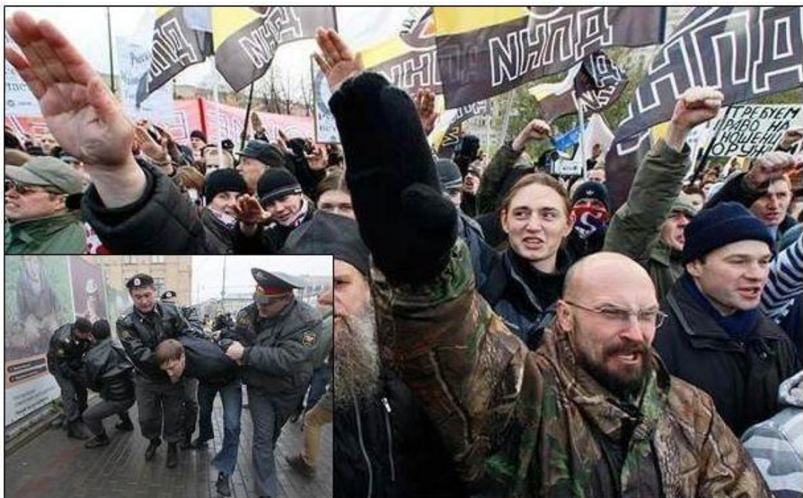
Het brengen van de Hitlergroet tijdens een nationalistische demonstratie wordt oogluikend toegestaan, terwijl een klein groepje demonstranten (zie inzet) die elke laatste dag van de maand komt demonstreren met harde hand wordt gearresteerd

Op de Russische TV wordt openlijk getoond dat de overheid blijkbaar "begrip" heeft voor deze vorm van xenofobie wanneer bij demonstraties op straat allerlei nationaalsocialistische leuzen en symbolen ongestraft worden megedragen en waarbij demonstranten tijdens de viering van Adolf Hitler's verjaardag op 20 april openlijk de nazigroet brengen zonder dat de politie ingrijpt. Deze grijpt echter wel hardhandig in, wanneer een enkele demonstrant met een kartonnen bord laat weten dat hij of zij een tegenstander is van het regeringsbeleid. Dat is immers een "demonstratie" waarvoor geen vergunning is aangevraagd.