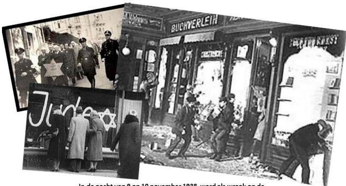
In de nacht van 9 op 10 november 1938, werd als wraak op de moord van de Duitse diplomaat Ernst Vom Raht, door de Jood Herschel Grynspan een orgie van geweld aangericht onder de Duitse joden.

opnieuw naar schuldigen zoeken en die ongetwijfeld opnieuw vinden onder de joodse medeburgers. De regering zal zich weliswaar officieel afkeren van een dergelijke ontwikkeling en wegkijken, maar dat de joden opnieuw in de rol van schuldigen zullen worden gedwongen, staat voor mij buiten kijf. Dat daarbij de zichzelf verrijkt hebbende oligarchen geen enkel nadeel van zullen ondervinden, ligt voor de hand. De rekening zal worden betaald door de onschuldige joodse meerderheid die part noch deel heeft gehad aan de tegenslagen van hun president. Putin' s grote belofte bij zijn aantreden was, dat hij er voor zou zorgen dat de levensstandaard van de "gewone Rus" verbeterd zou worden. Die belofte zal hij niet kunnen waarmaken. De Rus in de straat zal naar een zondebok zoeken. En die ongetwijfeld vinden.