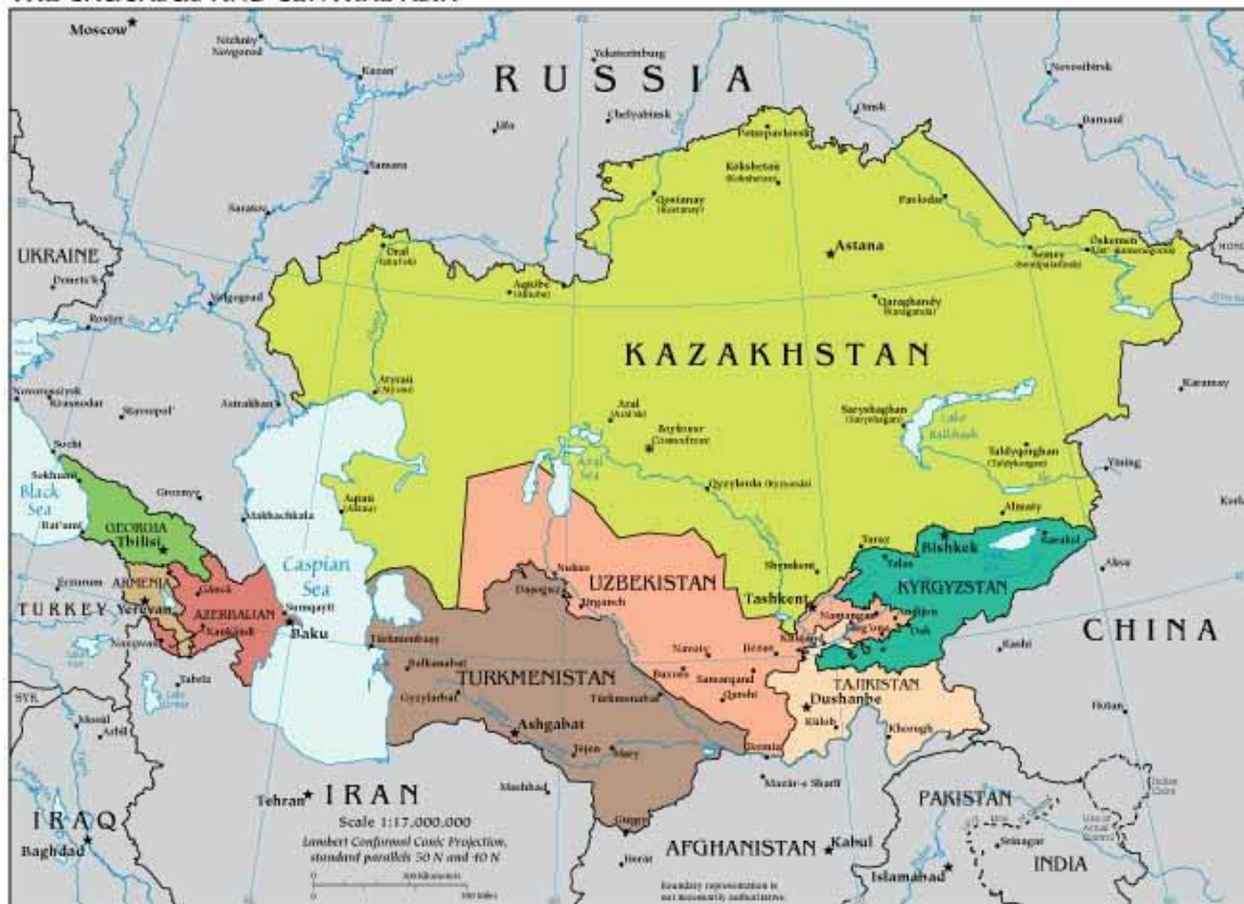
THE CAUCASUS AND CENTRAL ASIA

Onlangs heeft generaal Shogui , de Russische minister van Defensie, bevestigd dat Rusland problemen heeft in de zuidelijke periferie van het GIS-territoire. Uit zijn woorden bleek duidelijk dat het islamitische extremisme in Afghanistan aan de winnende hand is en signalen erop wijzen dat zij hun tentakels gaan uitstrekken naar het grensgebied met GIS-lidstaten. Hij kondigde tevens aan dat het Kremlin besloten heeft om militaire hulp aan de betreffende landen op te voeren en maatregelen zal treffen om die dreiging te neutraliseren en op te ruimen. Een doorstoot van bewapende islamitisch extremistische krachten over het grondgebied van zuidelijke GIS-lidstaten is onder de huidige omstandigheden wel het laatste waar Putin c.s. op zitten te wachten.