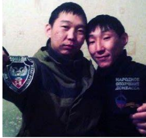
Centraal Aziatische "vrijwilligers" in de bezette bufferzone in Oekraïne

het Midden Oosten hebben veel vrijwilligers de rijen van de Taliban verlaten en hebben zich aangesloten bij IS. De hoofdreden is de betaling: IS betaalt zeven keer zo veel als de Taliban. Een tweede reden is de mondiale visie van IS: het realiseren van een Kalifaat dat zich uitstrekt over Midden Oosten, Centraal Azië en Noord Afrika. Op dit moment telt IS ruim 9000 vrijwilligers uit Rusland (o.a. Tsjetsjenië en Dagestan) en de armere Centraal Aziatische landen (m.n. Turkmenistan). Het is onduidelijk of en hoeveel van de voormalige kansarme mannen nog steeds de Taliban trouw zijn.