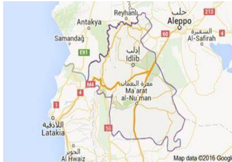
Detailkaart van het gebied waar Russische grondstrijdkrachten actief zijn