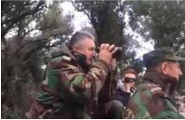
Russische "militaire adviseurs" aan het Syrische front tussen Latakia en Idlib