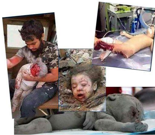
Resultaten van de Russische bombardementen in Syrië