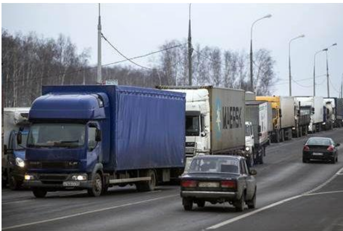
Stakende vrachtwagenchauffeurs op de ringweg rond Moskou

De Russische bevolking is door diverse oorzaken aan krimp onderhevig. Enerzijds veroorzaakt de afkalking van de gezondheidszorg een negatieve demografische verschuiving. Medicijnen om bijvoorbeeld de griep te bestrijden en HIV patiënten een langer leven te garanderen, zijn door de sancties niet meer beschikbaar. Het gevolg is dat door het ontbreken van de gewenste medicijnen de recente griepuitbraak geresulteerd heeft in een ongewoon hoog sterfte cijfer en ongeveer één miljoen HIV patiënten 2 moeten vrezen dat hun levensduur ernstig verkort kan worden. Anderzijds