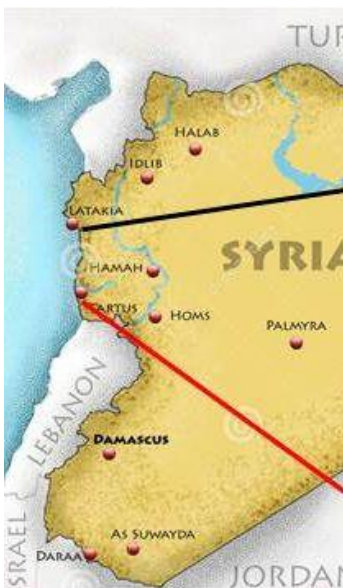
Zwart: Bestaande oliepijplijn Rood: Geplande oliepijplijn (Islamic Pipeline)

In 1971 maakte Syrië's president Hafez Al Assad, de vader van de huidige president, plannen om samen met andere Arabische landen Israël aan te vallen. De wapens die hij voor dat avontuur dacht nodig te hebben, zouden van de Sovjet Unie moeten komen. Voor minister van Buitenlandse Zaken; Andreij Gromiko, een niet te missen buitenkans om aan de Middellandse Zeekust voet aan de grond te krijgen en daarmee tegelijkertijd de toegang tot de Zwarte Zee bij de Bosporus te kunnen omzeilen.