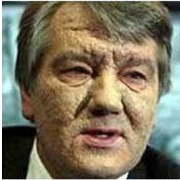
President Yushenko, die door een dioxinevergiftiging blijvende schade aan zijn gezicht heeft opgelopen

De doorgang van de Zwarte Zee naar de Middellandse Zee was weliswaar in principe toegankelijk, maar de Dardanellen en de Bosporus waren in handen van de Ottomaanse Turken zodat doorvaart naar de Middellandse Zee onmogelijk was. De Russen hebben getracht het Krimchiereiland te bezetten, maar werden door een gezamenlijke strijdmacht van Engelsen en Fransen in de Krimoorlog (1853-1856) verslagen. Pas op het einde van de 18 de eeuw slaagde Catharina de Grote er in om het Krimchiereiland te veroveren op de Tataren. 3 Zij liet er de havens en werven van Sebastopol aanleggen voor haar Zwarte Zeevloot en Odesa als commerciële haven. Toen in