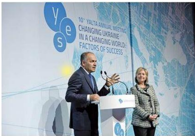
Pinchuk en Hillary Clinton tijdens de 10de Yalta European Strategy Conference

Clinton heeft echter nog een “geheim” dat haar politieke beslissingen als President van de Verenigde Staten op het internationale podium sterk kan kleuren. Kiezen voor Clinton betekent ook de acceptatie van duistere geldstromen om haar verkiezingscampagne van een solide financiële bodem te voorzien. Omdat bij het uitzetten van die geldstromen het Kremlin een indirecte maar wel herkenbare rol speelt, is dat beeld voor het grote publiek angstvallig verborgen gehouden. De rol van het Kremlin blijft helaas niet beperkt tot de geldstroom. Ook op een andere manier kan het Kremlin druk uitoefenen op toekomstige politieke beslissingen van de eerste vrouwelijke Amerikaanse President. Voor dat machtspeel worden Viktor Pinchuk, 5 een steenrijke Oekraïense mogul met sympathieën voor het doen en laten van Putin, en de SBER bank van Herman Gref gebruikt.