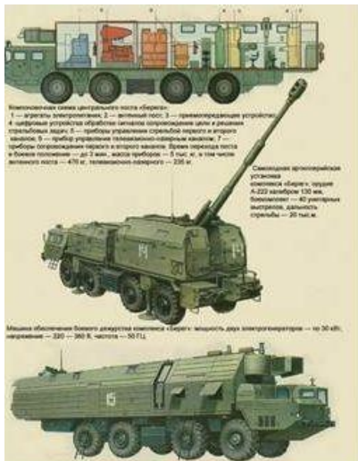
Gemotoriseerde artillerie: Bereg 130 mm SP

kustverdediging in Syrië heeft versterkt door de instroming van o.m. de Bereg 130 mm SP 7 en de SPU 35SP, die kruisraketten kan lanceren, gericht tegen zeedoelen.