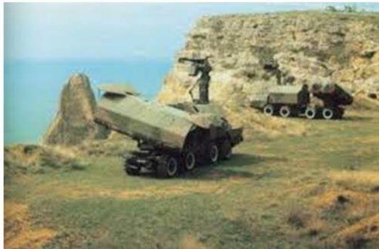
SPU 35 Self Propelled launcher met cruise raketten voor de kustverdediging

De vraag is wat Putin in de komende periode zal gaan doen. Van de USA kunnen we die reactie wel voorspellen: het zal beperkt blijven tot de bekende lege retoriek die Kerry en Obama al jaar en dag gebruiken om te voorkomen dat een brandende lont het Midden Oosten kruitvat definitief doet ontploffen. Wil Putin een eventuele inval met kracht voorkomen, dan zal hij een relevante vier-dimensionale afschrikking moeten opbouwen in Syrië en die signalen zijn tot nu toe nog niet herkenbaar.