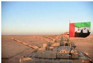
Exercise “ Northern Thunder ”

Na de echecs van het gewapende treffen met Israel enige decennia geleden, de symbolische bijdrage aan de tweede Golfoorlog in het begin van de jaren '90 en de huidige strubbelingen in Jemen, schrijven en praten westerse kenners nog steeds met veel dédain over de gevechtskracht en operationele ervaring van Arabische strijdmachten. De vraag is