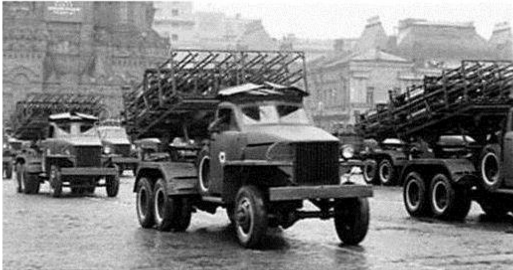
Studebakers met daarop Katoesja's lanceerinrichtingen op het Rode Plein, 1943