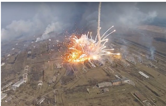
Oekraïens mobilisatiecomplex annex munitie-opslagplaats bij Balaklyia, omgeving Kharkiv.

Politici en media is het ontgaan dat onder hun neus het Kremlin opnieuw bezig is met het reorganiseren, versterken en aantrekken van gevechtskracht in de Donbass en het grensgebied met Rusland om de bestaande grenzen in historisch opzicht te 'corrigeren'.