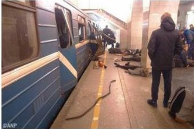
De bomaanslag op 13 april 2017 tegen een metrotrein in Sint Petersburg

dergelijke verbinding niet kleiner gemaakt. Sterker nog. Ondersteund door extremistische structuren uit één of meerdere Centraal Aziatische staten, heeft het terroristische geweld Sint Petersburg bereikt 1 en strekt het islamitisch extremisme zijn tentakels vanuit de Noord Kaukasus 2 naar het hartland van Rusland uit. Het is daardoor zelfs de doorsnee Rus duidelijk geworden dat de veiligheid van Rusland ernstig in het gedrang kan komen en dit moet, gezien de huidige economische malaise, voor de nabije toekomst zeker geen geruststellende gedachte zijn.