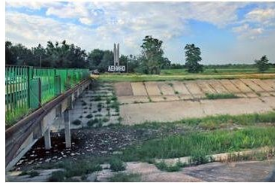
Het "Noord Krim Kanaal" Een van de redenen van Chroetsjov om de Krim op 19 februari 1954 aan Oekraïne toe te wijzen

Op dit moment leeft 15 % van de Russische bevolking, een kleine 22 miljoen Russen, onder de armoedegrens. Dat is 5 miljoen méér dan vijf jaar geleden. 5 Twee derde van de bevolking heeft geen geld in de beurs om dagelijks een warme maaltijd op tafel te zetten. Op het platteland verslechtert de economische situatie progressief. Zelfs nog sneller dan in de regio Moskou. Ondanks geruststellende woorden van Poetin, benadrukt door de immer papegaaierende staatsmedia, hebben financiële experts gewaarschuwd dat het Russische banksysteem voor een bankroet staat.