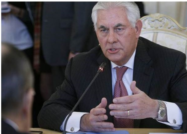
Minister van Buitenlandse zaken Rex Tillerson in gesprek met minister Lavrov op 12 april tijdens hun ontmoeting in Moskou

Tijdens zijn verkiezingscampagne en kort na zijn overwinning heeft dealmaker Trump wel eens laten doorschemeren in de markt te zijn voor een overeenkomst met Poetin. Samen met de Russische potentaat meent hij meer kans te hebben om de twee gezichten van het islamitische kwaad - IS en Al Qaida - te vernietigen. Een win-win situatie. Begin dit jaar heeft hij de Amerikaanse minister van Buitenlandse Zaken Tillerson opdracht gegeven om te zoeken naar een opening de Westerse sancties te versoepelen en een overeenkomst te