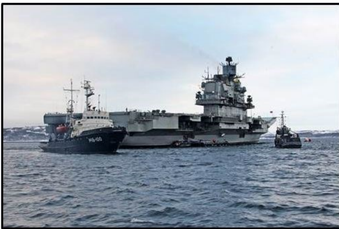
Admiral Kutznetsov and her loyal "private" tugboat"

Net zoals in de USA en veel Europese staten speelt ook bij andere Russische krijgsmachtdelen een aantal problemen dat een effectief, evenwichtig en langdurend drie- of vierdimensionaal operationeel optreden frustreert. Het vliegdekschip Admiraal Kutznetsov is het veronderstelde vlaggenschip van de maritieme component. Het schip zou in navolging van zijn Amerikaanse tegenhanger, de hoeksteen moeten vormen van een Carrier Strike Group (CSG) om open water operaties op afstand te kunnen uitvoeren zonder afhankelijk te zijn van landbased operationele faciliteiten en infrastructuur. 5 Het schip - ontplooid in het oostelijke deel van de Middellandse Zee om de bestrijding van anti-Assad strijdmachten in de Syrische Zandbak te ondersteunen - keerde volgens het internationale geruchtencircuit, om voor het Westen onbekende redenen, terug naar de thuishaven.