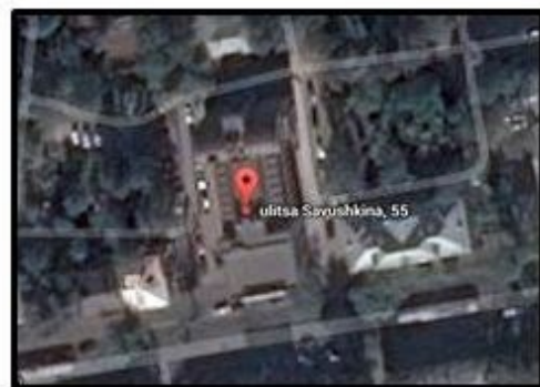
Internet Research Agency in de ul. Savushkina nr 55, Saint Petersburg