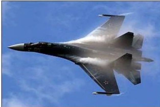
De Sukhoi 35 waar vanwege gebrek aan fondsen slechts 14 exemplaren zijn gebouwd

gesteld kan worden en is het nog maar de vraag of het platform kan concurreren met een Chinese en Indiase tegenhanger. Het is wel zeker dat het platform niet de gewenste kwaliteitshoeksteen van een Carrier Strike Group (CSG) zal zijn voor blue of open water operaties, zonder afhankelijk te zijn van landbased operationele faciliteiten en infrastructuur. ii