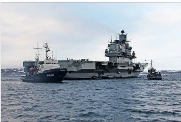
Het vliegkampschip "Admiraal Kutznetsov, die vanwege haar onbetrouwbare voortstuwing een "vaste" begeleidende sleepboot heeft.

Onlangs heeft hij een eerste poging daartoe ondernomen. In een toespraak voor fabrieksarbeiders heeft hen proberen te overtuigen dat de economie van Rusland er "goed voorstaat". Hij beweerde dat het begrotingstekort kleiner was geworden en buitenlandse investeringen sterk waren gegroeid. Meer dollars stromen in de schatkist. Bewust vergat hij aan te geven in hoeverre zijn gehoor zou gaan profiteren van die plotselinge economische oprisping, omdat hij wist dat er geen extra roebel in hun loonzakje te vinden zou zijn. Vermoedelijk hebben die fabrieksarbeiders dat zelf ook wel in de gaten, omdat zij met eigen ogen zien dat de productie die hoofdzakelijk verbonden is met Defensie-opdrachten, niet groeit, maar krimpt.