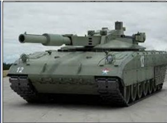
De ARMATA T-14 waarvan slechts 75 van de geplande 2300 exemplaren zijn afgeleverd

Behalve de maritieme component zullen ook de land en luchtcomponent de klos worden van de slechte financiële toestand. De moderniseringsplannen voor de luchtcomponent; de MIG 29SMT en de MIG 35 Fulcrum , zijn op een laag pitje gezet. Naast deze aanval- en verdedigingsplatformen is het nog de vraag of een nieuwe strategische bommenwerper Tu-160 Blackjack kan worden ontwikkeld. Door de budgetkrimp bezit de luchtcomponent weliswaar platformen met een grote gevechtswaarde, maar wordt de gebruikswaarde aangetast door het gebrek aan onderhoud, reservedelen etc. Het financieel onhaalbare voornemen om 2300, per stuk 1 miljard roebel kostende, ARMATA T-14 tanks voor de grondstrijdkrachten aan te schaffen, is ook op een laag pitje gezet. Tot nu toe zijn er slechts 75 tanks in de bewapening opgenomen en verdere productie is voorlopig stop gezet. Het beeld van de teruglopende industriële productie wordt in onderstaand schema duidelijk.