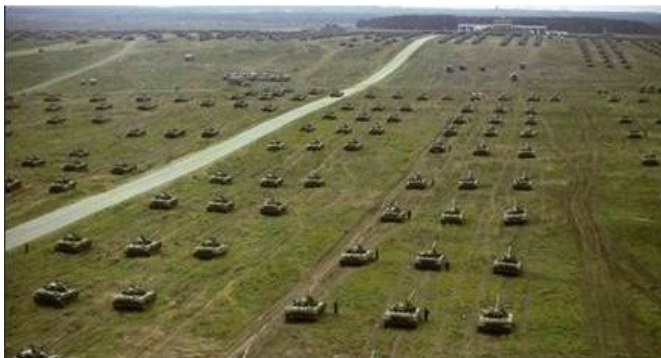
De T 72 tankzware tegenaanval.

De eerste oefeningsfase (14-16 september) had - volgens de The Guardian journalist ter plaatse - een defensief karakter om in de tweede fase (18-20 september) een meer (tegen) offensieve aard te krijgen. Volgens Duitse media startte de Westelijke Alliantie de eerste fase van het oefenscenario met een offensief over een breed front om Veishnoria te bezetten, waarna vervolgens pogingen ondernomen zouden worden om Veishnoria los te weken van Belarus. Het uiteindelijke doel zou zijn dat militanten gesteund door de twee geallieerde landen; Vesbarija en Lubenia , de regering in Minsk omver wilden werpen. De gecombineerde Minsk-Moskou strijdmacht moest het door de extremisten gevormde bruggenhoofd afblokken en de gewenste randvoorwaarden realiseren in termen van